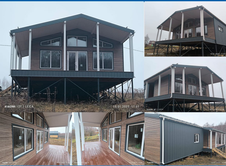
Дом из СИП панелей 125 м2. Московская область, Каширский район, дер. Елькино