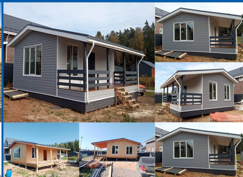
Дом из СИП панелей. 65 м2. Московская обл., Пушкинский район, КП "Вдохновение Пушкина"