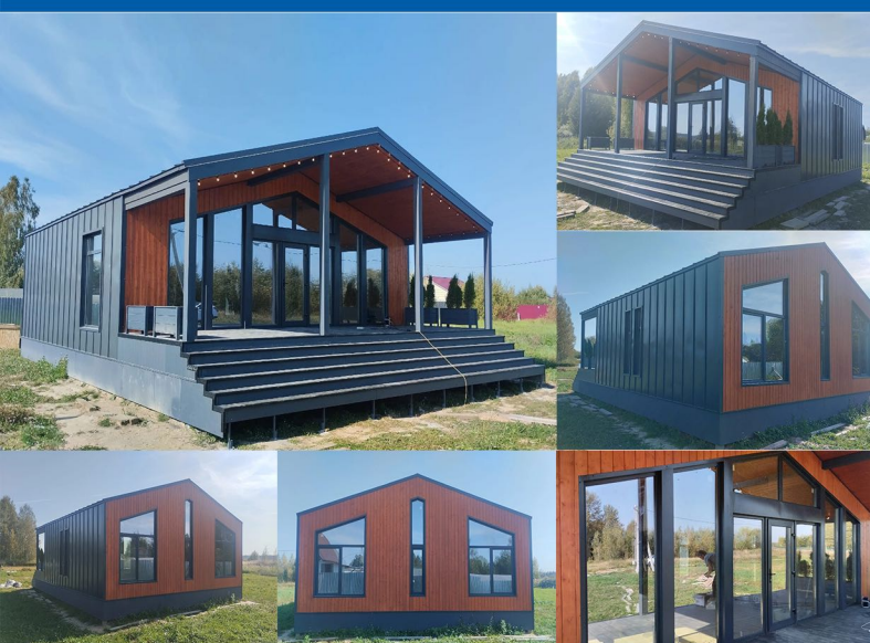
Барн Хаус из СИП панелей 118 м2. Московская обл., Волоколамский район, дер. Новоникольское