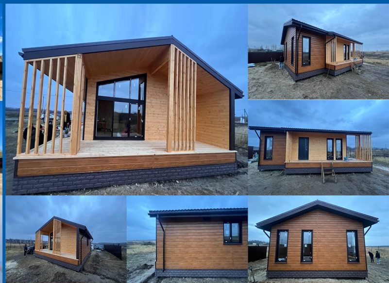
Дом из СИП панелей. 84 м2. Владимирская область, Собинский район, дер. Юрино