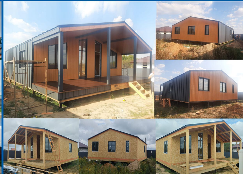
Барн Хаус из СИП панелей 118 м2. Ивановская область, г. Тейково