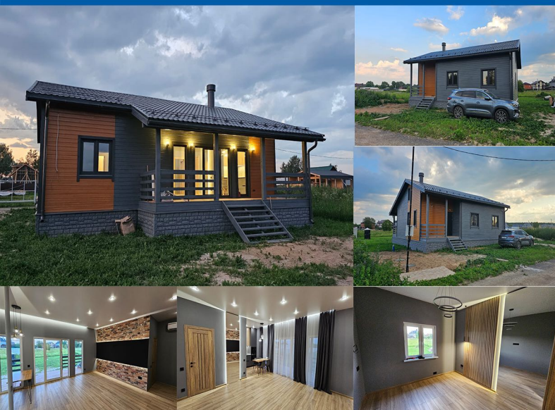
посёлок ЭкоКвартал Раздолье, 765 Раменский городской округ, Московская область