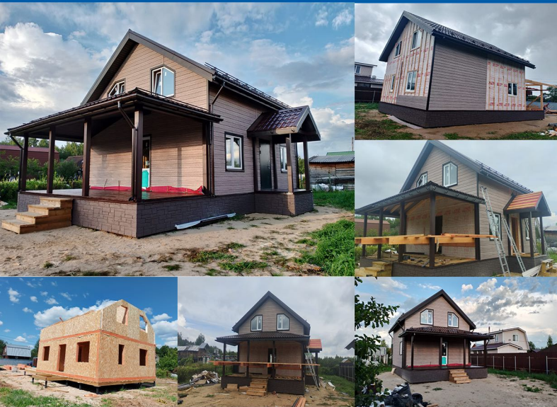
Дом из СИП панелей 135 м2. Московская область, город Орехово Зуево