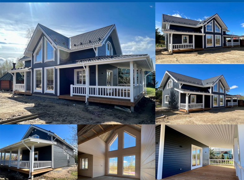
Дом по каркасной технологии 145 м2. Тульская область г.Алексин