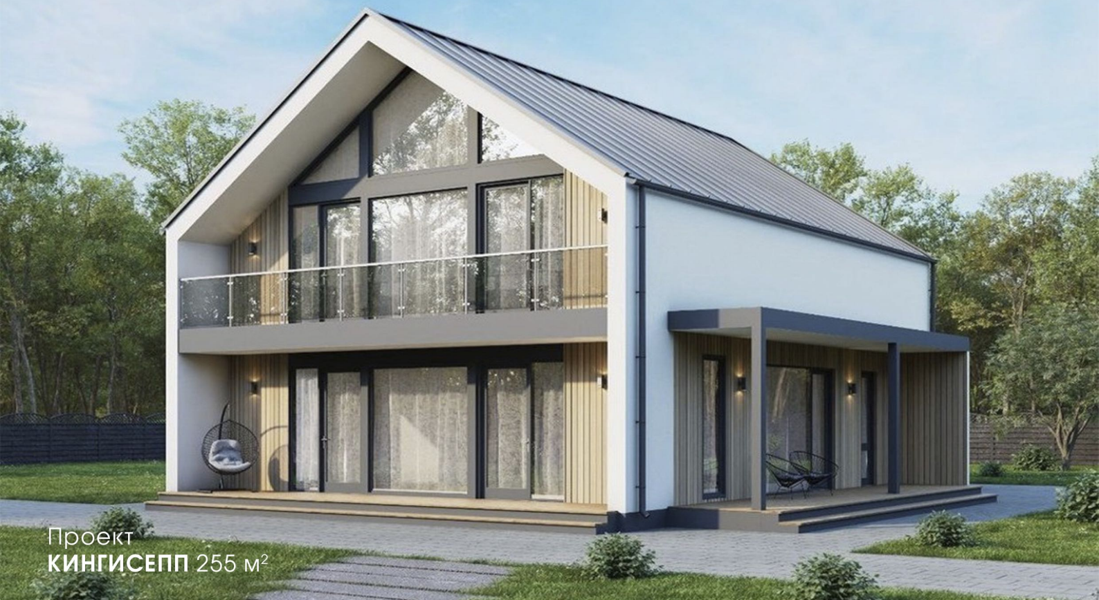
Проект КИНГИСЕПП 255 м 2