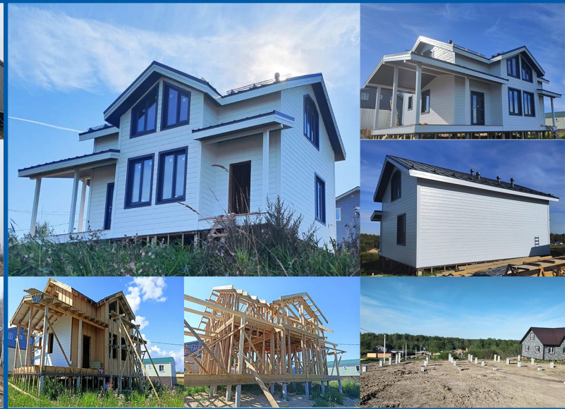
Дом по каркасной технологии. Тверская область г. Бежецк